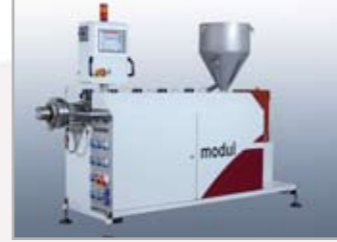
Einschneckenextruder modul-s Singlescrew-Extruder module-s