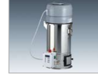
Saugfördergerät Hopper loader