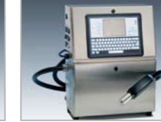
Tintensigniergerät Inkjet Printer