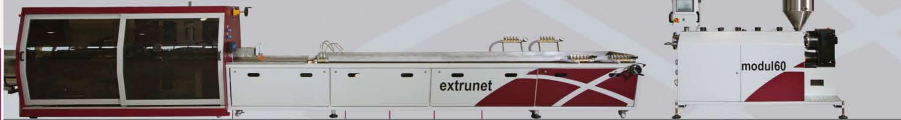
exflex Kalibrierung | Calibrator