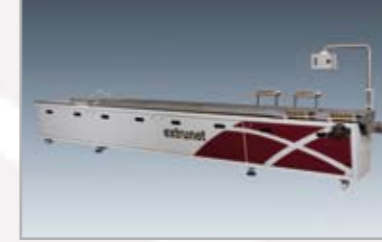
Kalibriertisch modul-s Calibration table modul-s