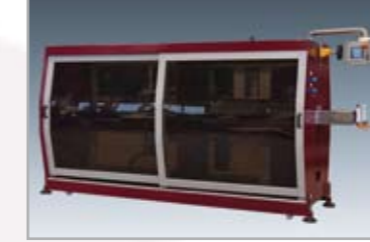
Abzug/Säge modul-s Puller/Saw modul-s